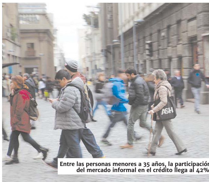
Entre las personas menores a 35 años, la participación del mercado informal en el crédito llega al 42%.

Con este escenario, desde la Asociación de Bancos (Abif) comentaron esta situación es “preocupante si